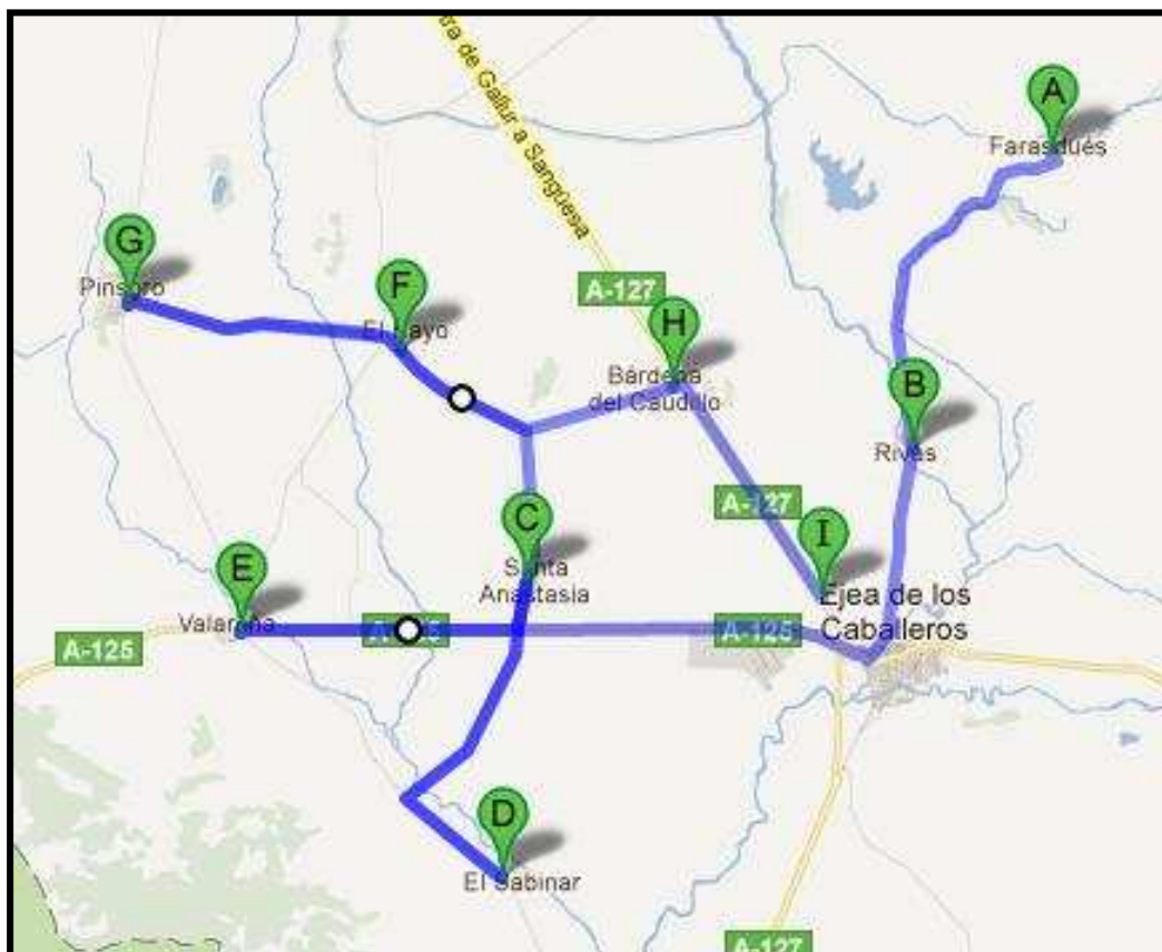
Plano Itinerario a seguir por la II Cabalgata Motero Solidaria.

FARASDUÉS, RIVAS, SANTA ANASTASIA, EL SABINAR, VALAREÑA, PINSORO, EL BAYO, BARDENAS Y FINALMENTE REGRESO A EJEA DE LOS CABALLEROS.